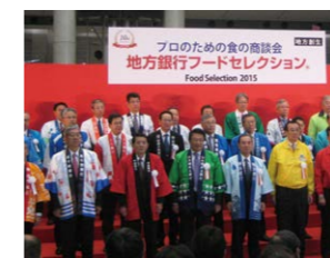
フードセレクション2015