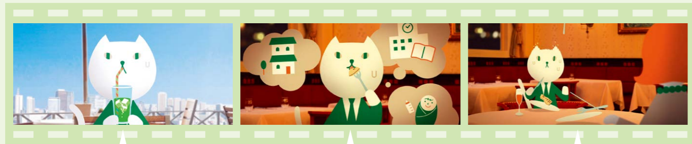
いつでも使える(24時間365日振込可能)篇

http://www.resona-gr.co.jp/holdings/about/brand/omni.html