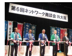
第6回ネットワーク商談会 IN 大阪